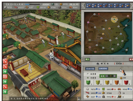
▲弟子的滿意度是決定門派是收學費還是付薪資的重要指標！

〔光譜電子報 Marlos/台北報導〕看過上一期練武篇的介紹後，相信大家對弟子的武術安排，都已經有初步的認識了，本期我們將繼續帶來讓門派轉虧為盈的小撇步，預祝大家都能大把大把的將銀兩賺進來，並請密切留意我們下一期行程篇的介紹。