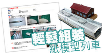
▲紙模型教學網頁讓你輕鬆組裝紙模型列車。

在「A列車8」啟動的官網中，除了遊戲資訊外，還開放遊戲畫面區及一系列鐵道迷們不可錯過的相關連結區，除了有鐵道資訊的相關網站、分享台灣鐵道照片及遊記的鐵道迷部落格、紀錄全世界美麗列車倩影的攝影網站等，還