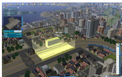
▲蓋個車站可以活絡一下當地經濟及觀光喔！

股市的炒作，子公司等相關企業的營運，就算手頭資金不夠，還能找銀行進行信用貸款來應急。